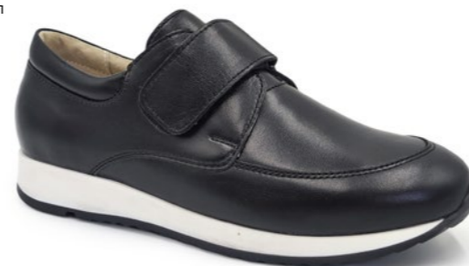
сандалии для первоклашек: 44592 170-200 натуральная кожа натуральная кожа тэп