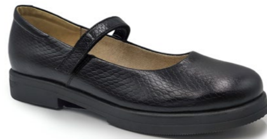
полуботинки для школьников-девочек: 64/74646 31-38 натуральная кожа натуральная кожа тэп