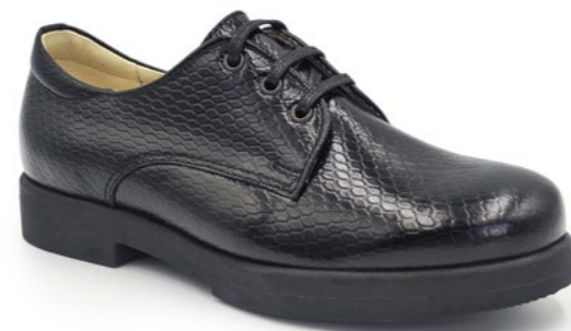
полуботинки для школьников: 64876 32-35 натуральная кожа натуральная кожа + текстильный материал тэп