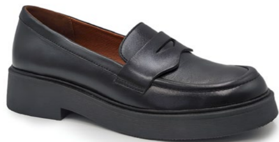
туфли для школьников-девочек: 64923 31-37 натуральная кожа натуральная кожа тэп