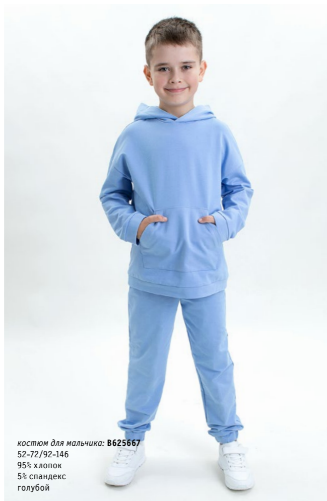
костюм для мальчика: B625667 52-72/92-146 95% хлопок 5% спандекс голубой