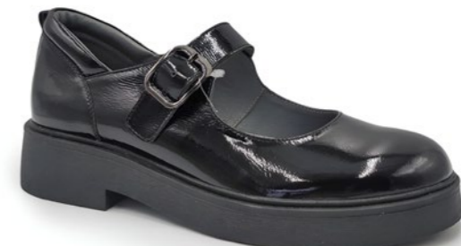
туфли для школьников-девочек: 64951 31-38 натуральная кожа натуральная кожа тэп