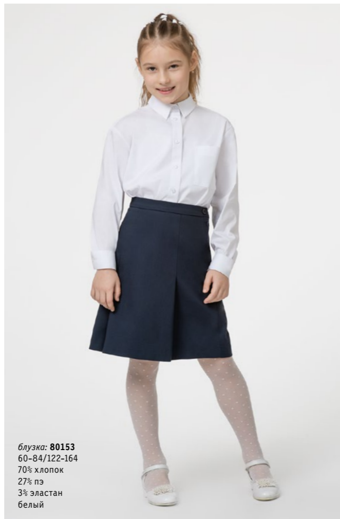
блузка: 80153 60-84/122-164 70% хлопок 27% пэ 3% эластан белый