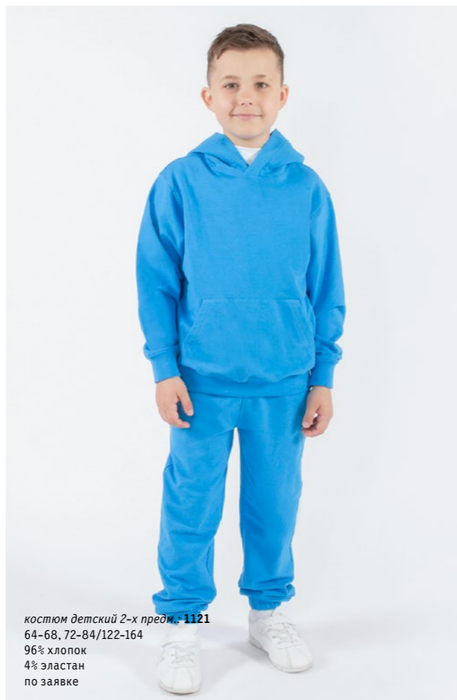
костюм детский 2-х предм.: 1121 64-68, 72-84/122-164 96% хлопок 4% эластан по заявке