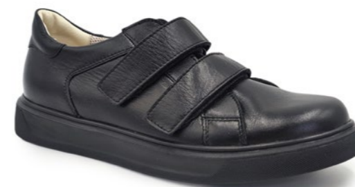
полуботинки для школьников-мальчиков: 65/75039 32-43 натуральная кожа натуральная кожа тэп