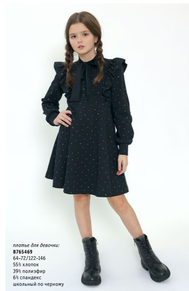
платье для девочки: В765469 64-72/122-146 55% хлопок 39% полиэфир 6% спандекс школьный по черному

Благодаря хлопку полотно обладает гигиеничностью, хорошо пропускает воздух, а нити полиэфира и спандекса помогают долго сохранить свою первоначальную форму и насыщенность цвета.