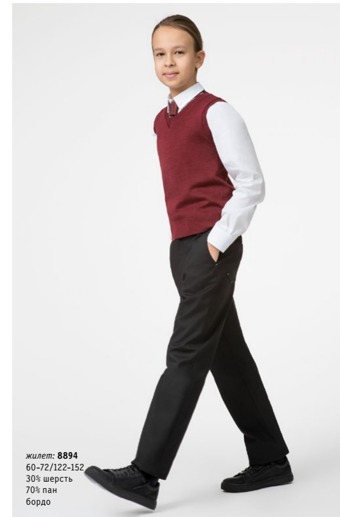
жилет: 8894 60-72/122-152 30% шерсть 70% пан бордо