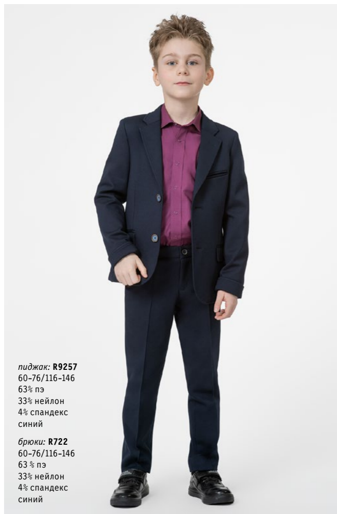
пиджак: R9257 60-76/116-146 63% пэ 33% нейлон 4% спандекс синий брюки: R722 60-76/116-146 63% пэ 33% нейлон 4% спандекс синий