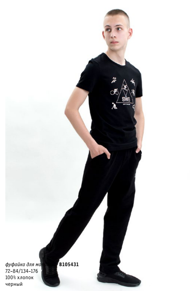
фуфайка для мальчика: B105431 72-84/134-176 100% хлопок черный