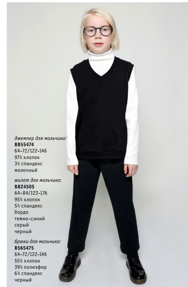
джерсер для мальчика: В855474 64-72/122-146 97% хлопок 3% спандекс молочный