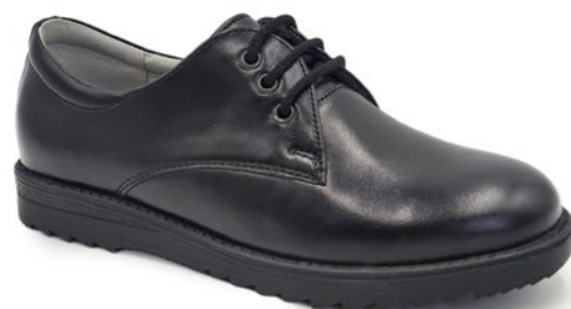
полуботинки для школьников-мальчиков: 64916 32-37 натуральная кожа натуральная кожа тэп