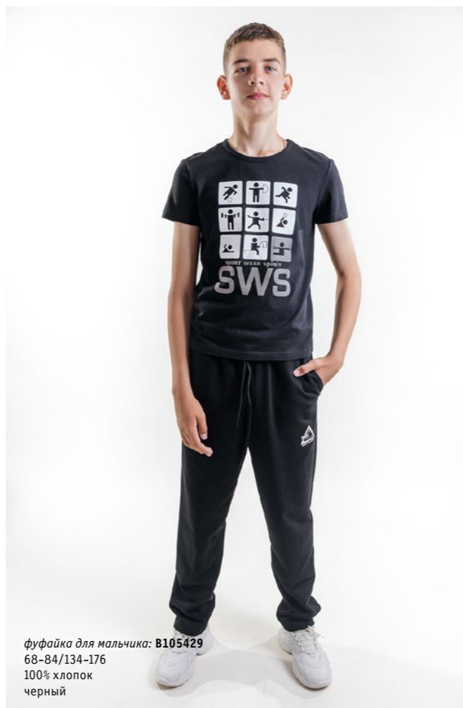
фуфайка для мальчика: B105429 68-84/134-176 100% хлопок черный