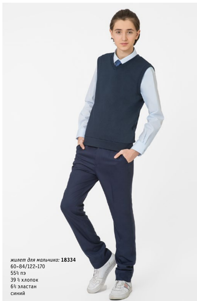
жилет для мальчика: 18334 60-84/122-170 55% пэ 39% хлопок 6% эластан синий