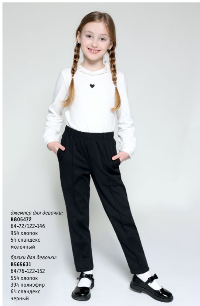
джерсер для девочки: В805472 64-72/122-146 95% хлопок 5% спандекс молочный