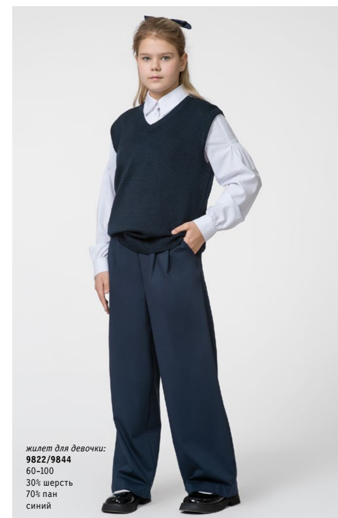
жилет для девочки: 9822/9844 60-100 30% шерсть 70% пан синий