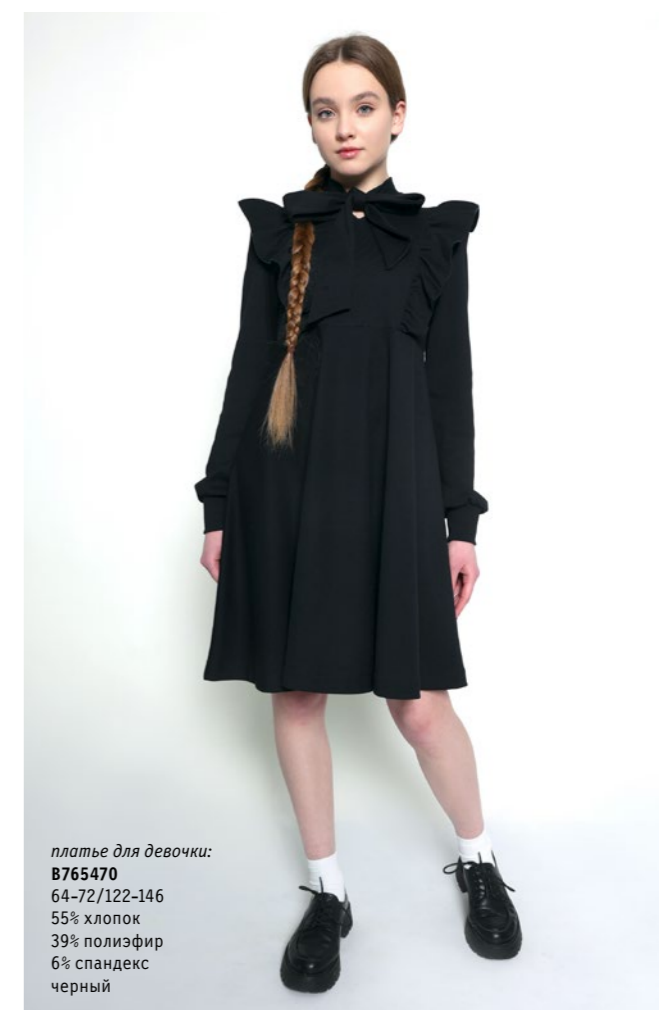
платье для девочки: В765470 64-72/122-146 55% хлопок 39% полиэфир 6% спандекс черный