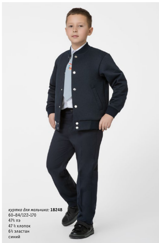
куртка для мальчика: 18248 60-84/122-170 47% пэ 47% хлопок 6% эластан синий