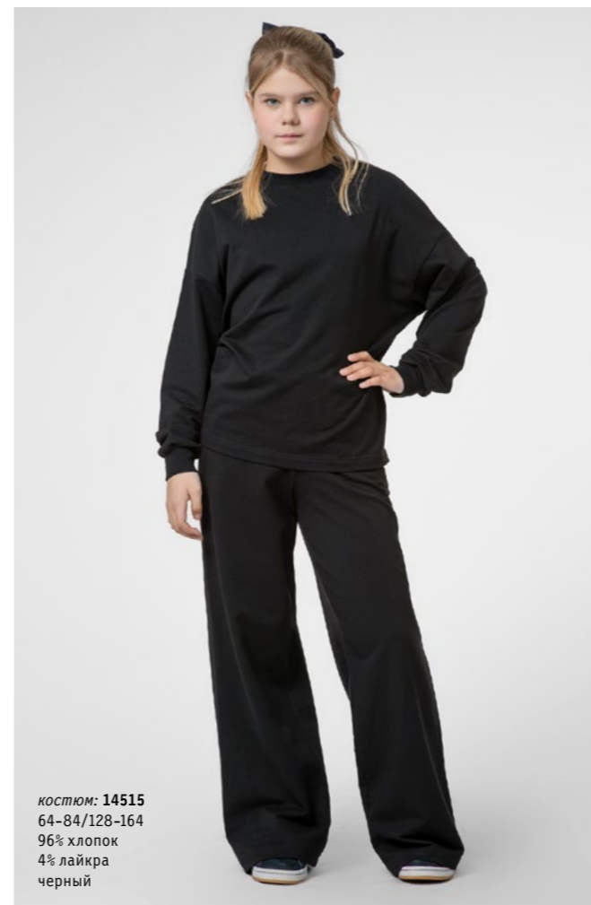
костюм: 14515 64-84/128-164 96% хлопок 4% лайкра черный