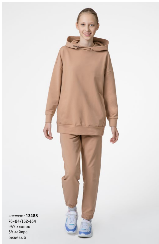
костюм: 13488 76-84/152-164 95% хлопок 5% лайкра бежевый