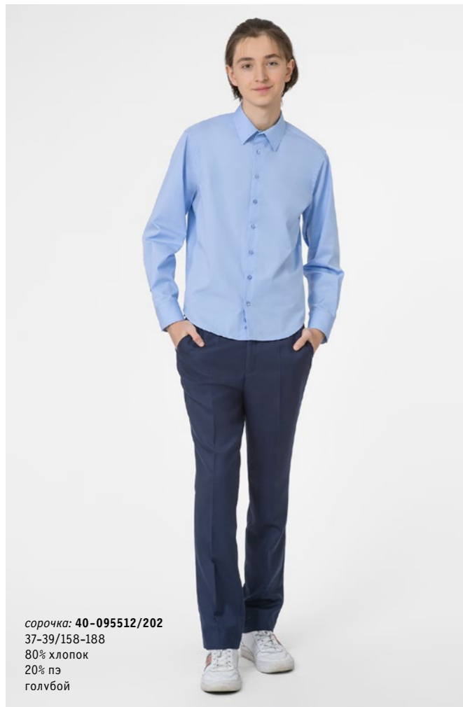
сорочка: 40-095512/202 37-39/158-188 80% хлопок 20% пэ голлбой