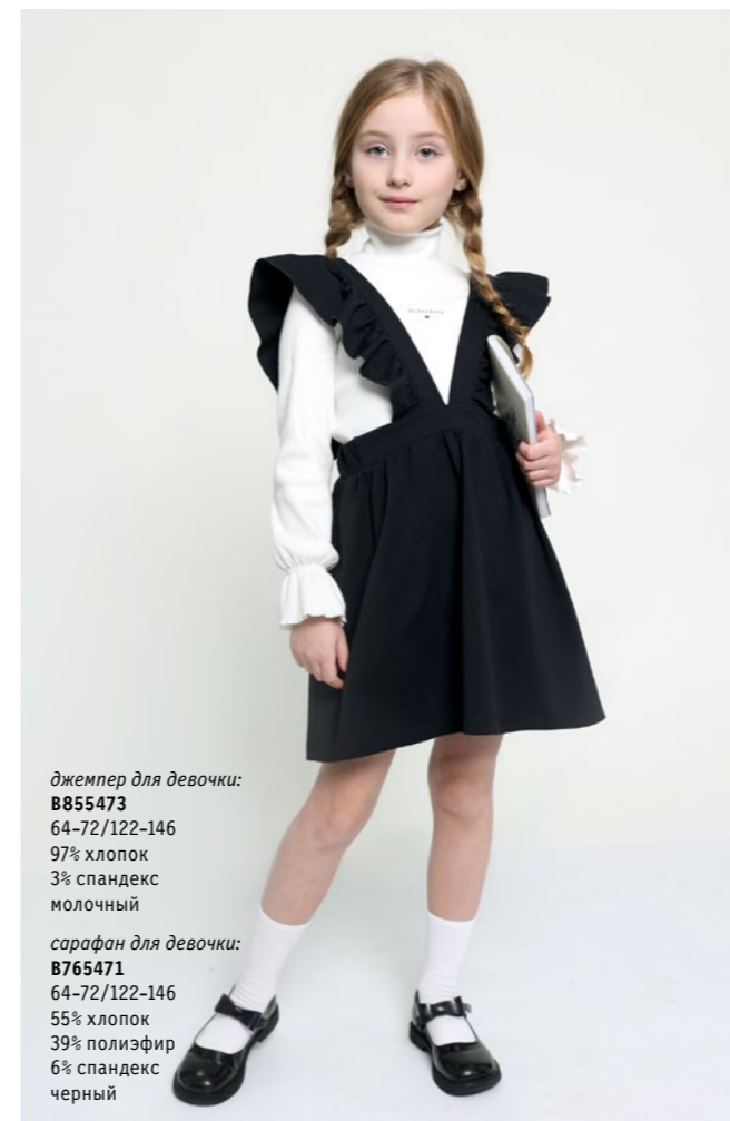
джерсер для девочки: В855473 64-72/122-146 97% хлопок 3% спандекс молочный