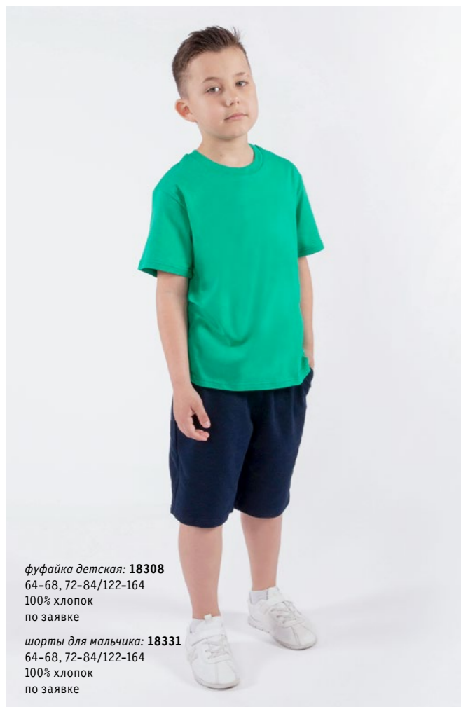
фудайка детская: 18308 64-68, 72-84/122-164 100% хлопок по заявке