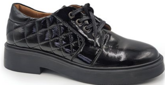
полуботинки для школьников-мальчиков: 64600 33-36 натуральная кожа натуральная кожа тэп