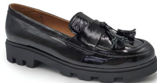
туфли для школьников-девочек: 64920 31-38 натуральная кожа натуральная кожа тэп