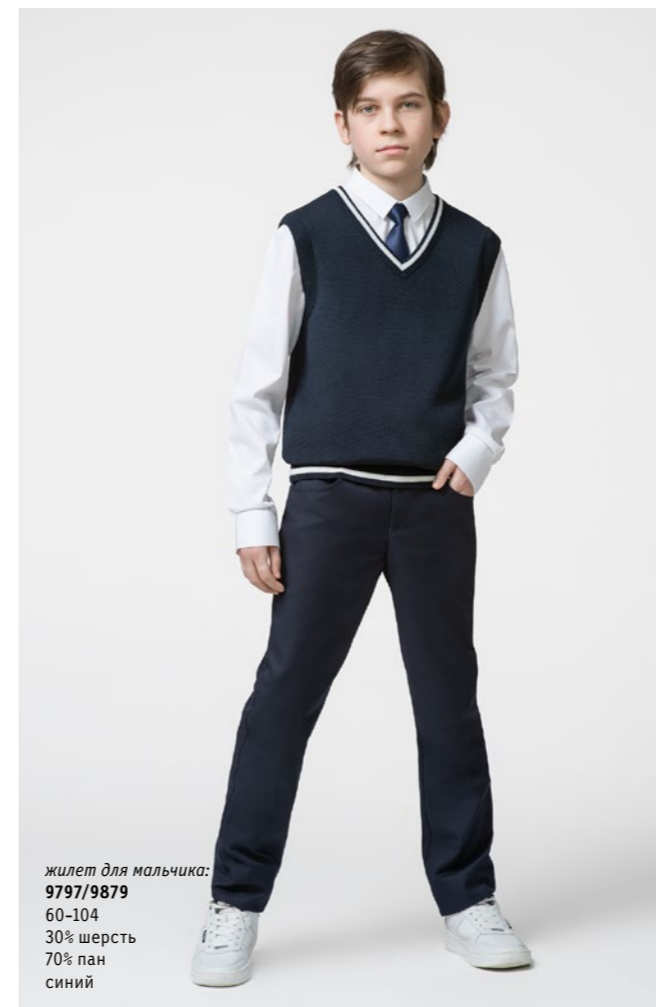
жилет для мальчика: 9797/9879 60-104 30% шерсть 70% пан синий