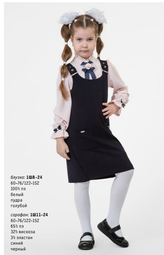
блузка: 1Ш8-24 60-76/122-152 100% пэ белый пудра голубой

С брендом TAMMI девочки выделяются стилем и элегантностью свойственным только истинным леди.