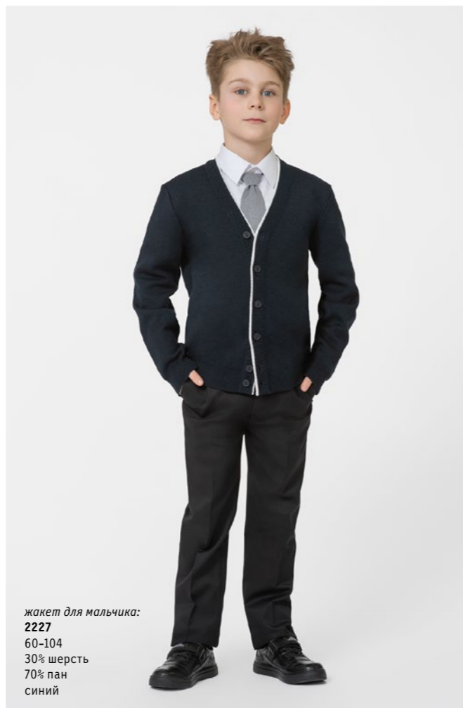
жакет для мальчика: 2227 60-104 30% шерсть 70% пан синий