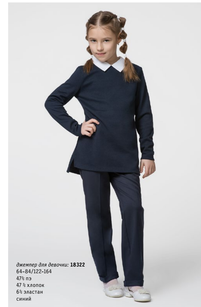
джерсер для девочки: 18322 64-84/122-164 47% пэ 47% хлопок 6% эластан синий