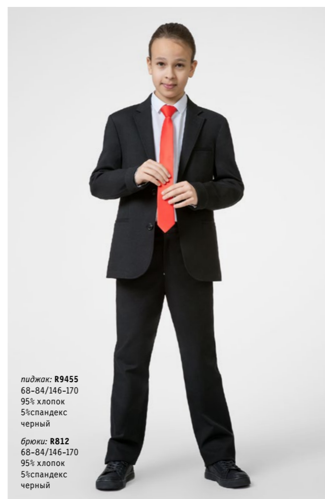
пиджак: R9455 68-84/146-170 95% хлопок 5% спандекс черный брюки: R812 68-84/146-170 95% хлопок 5% спандекс черный

COMINTERN – это одежда для тех, кто ценит лаконичность, стиль и практичность.