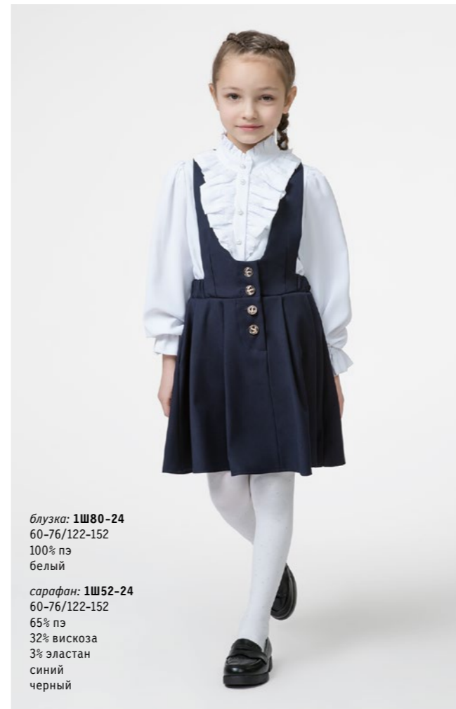
блузка: 1Ш80-24 60-76/122-152 100% пэ белый