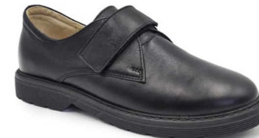
полуботинки девочки: 64/74934 36-41 натуральная кожа натуральная кожа тэп