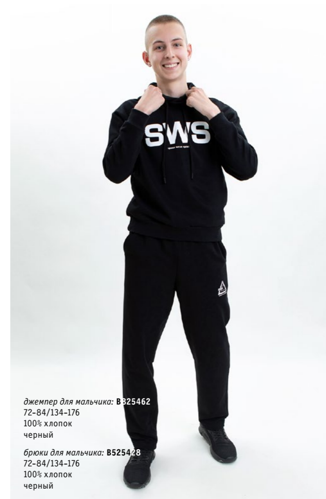
джерсер для мальчика: B325462 72-84/134-176 100% хлопок черный брюки для мальчика: B525428 72-84/134-176 100% хлопок черный