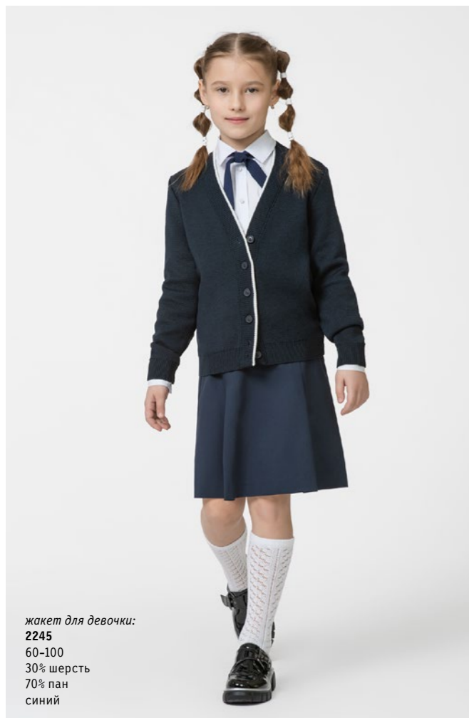
жакет для девочки: 2245 60-100 30% шерсть 70% пан синий