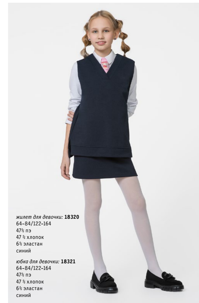
жилет для девочки: 18320 64-84/122-164 47% пэ 47% хлопок 6% эластан синий юбка для девочки: 18321 64-84/122-164 47% пэ 47% хлопок 6% эластан синий