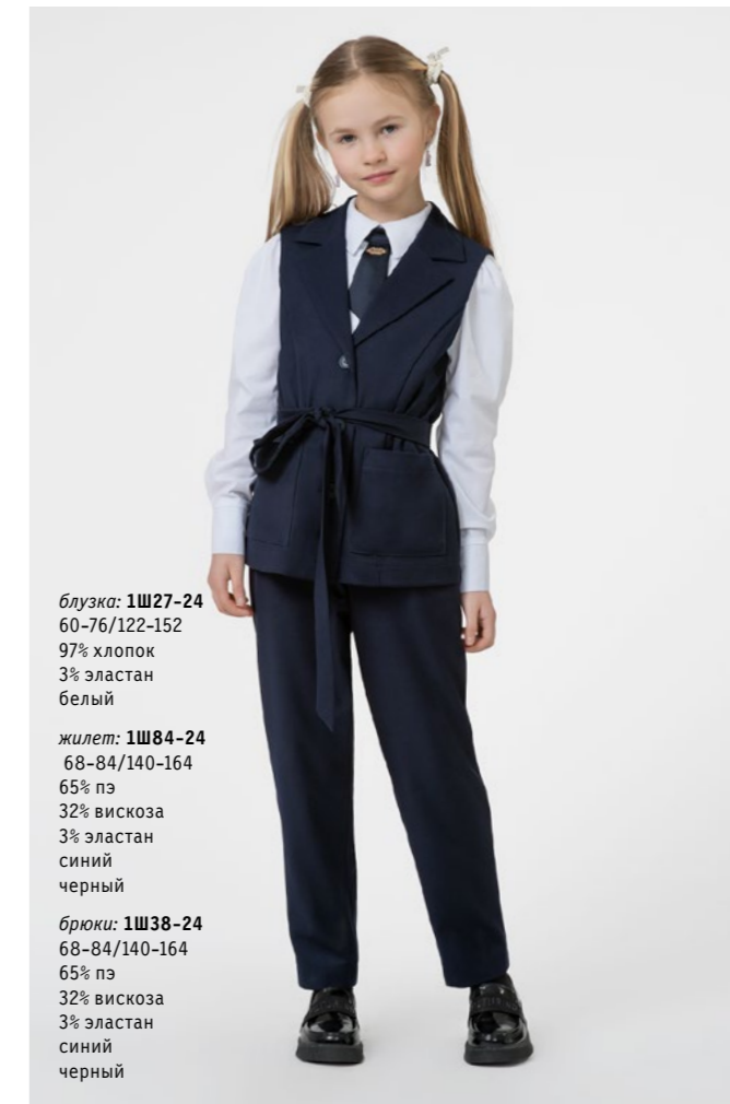
блузка: 1Ш27-24 60-76/122-152 97% хлопок 3% эластан белый