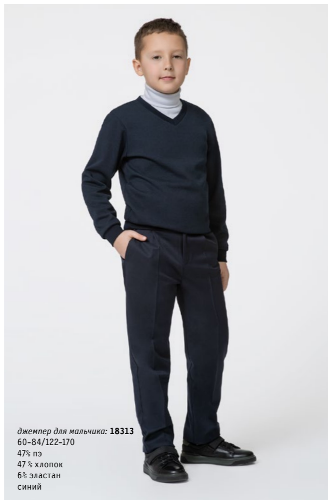
джерпер для мальчика: 18313 60-84/122-170 47% пэ 47% хлопок 6% эластан синий