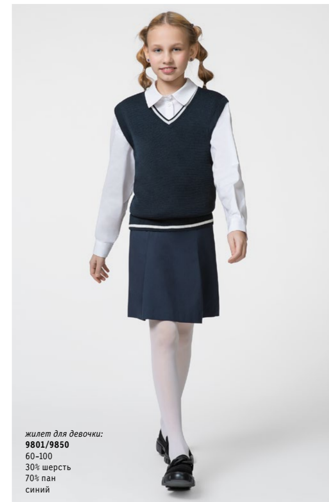
жилет для девочки: 9801/9850 60-100 30% шерсть 70% пан синий