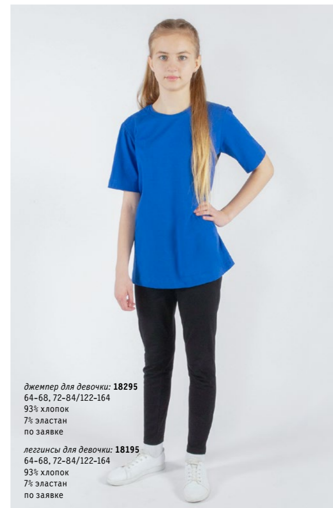
джерпер для девочки: 18295 64-68, 72-84/122-164 93% хлопок 7% эластан по заявке