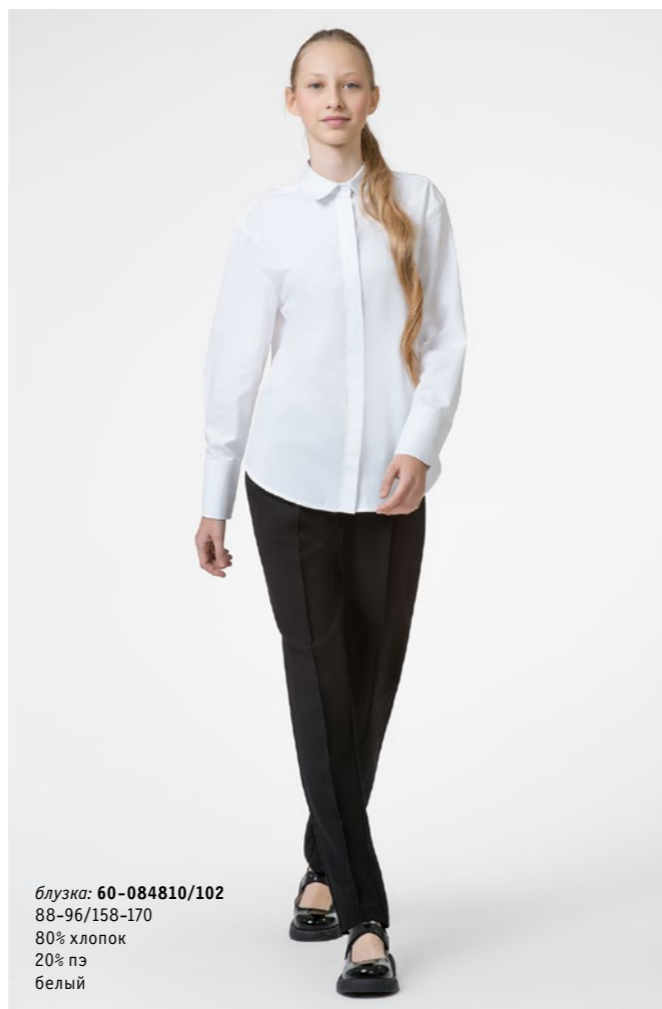
блузка: 60-084810/102 88-96/158-170 80% хлопок 20% пэ белый