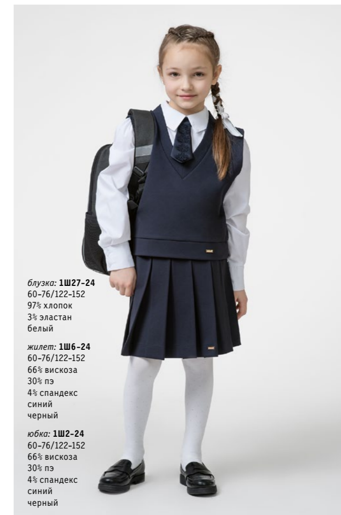
блузка: 1Ш27-24 60-76/122-152 97% хлопок 3% эластан белый