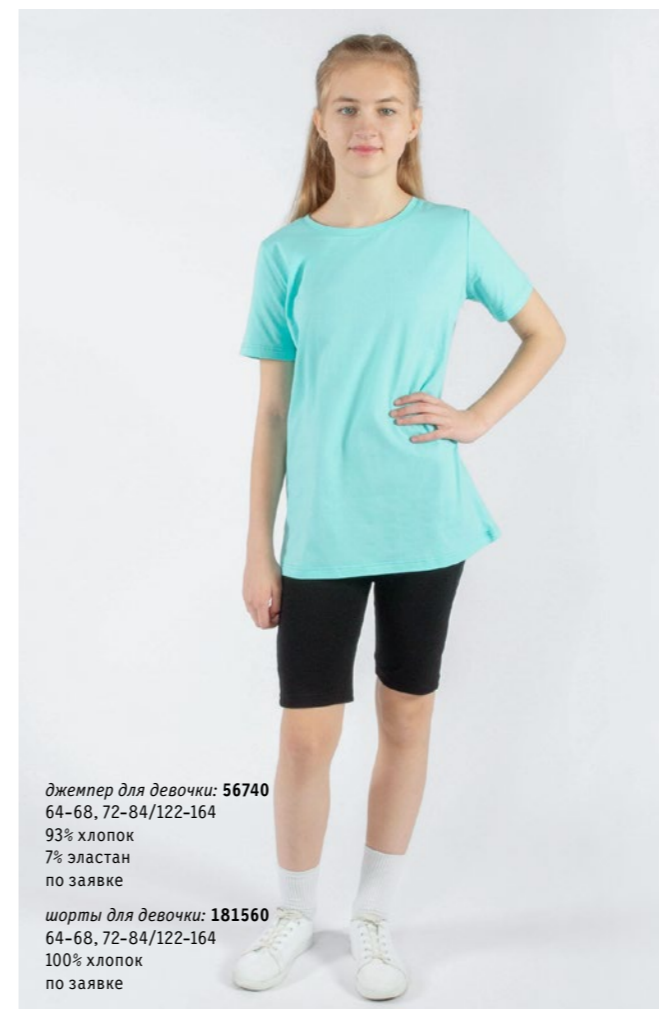
джерпер для девочки: 56740 64-68, 72-84/122-164 93% хлопок 7% эластан по заявке