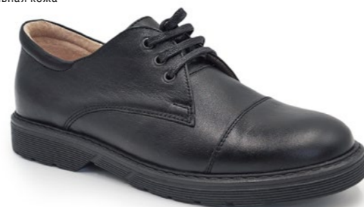
полуботинки для школьников: 64780 32-37 натуральная кожа натуральная кожа полиуретан