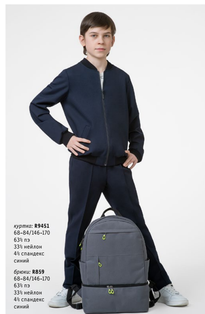
куртка: R9451 68-84/146-170 63% пэ 33% нейлон 4% спандекс синий брюки: R859 68-84/146-170 63% пэ 33% нейлон 4% спандекс синий