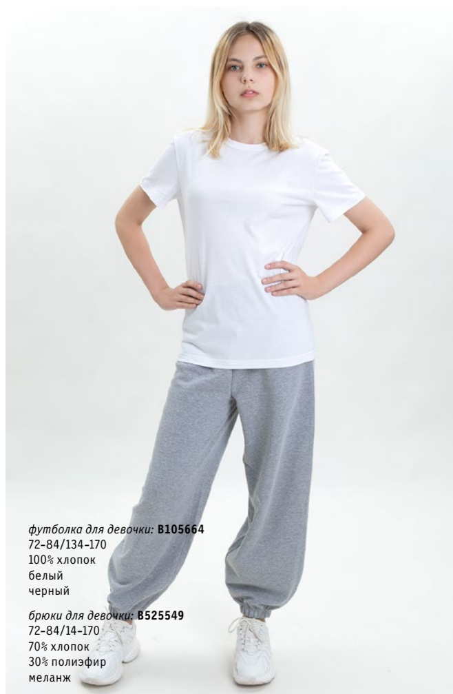
футболка для девочки: B105664 72-84/134-170 100% хлопок белый черный брюки для девочки: B525549 72-84/14-170 70% хлопок 30% полиэфир меланж