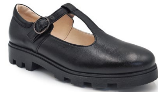
туфли для школьников-девочек: 65090 31-37 натуральная кожа натуральная кожа тэп