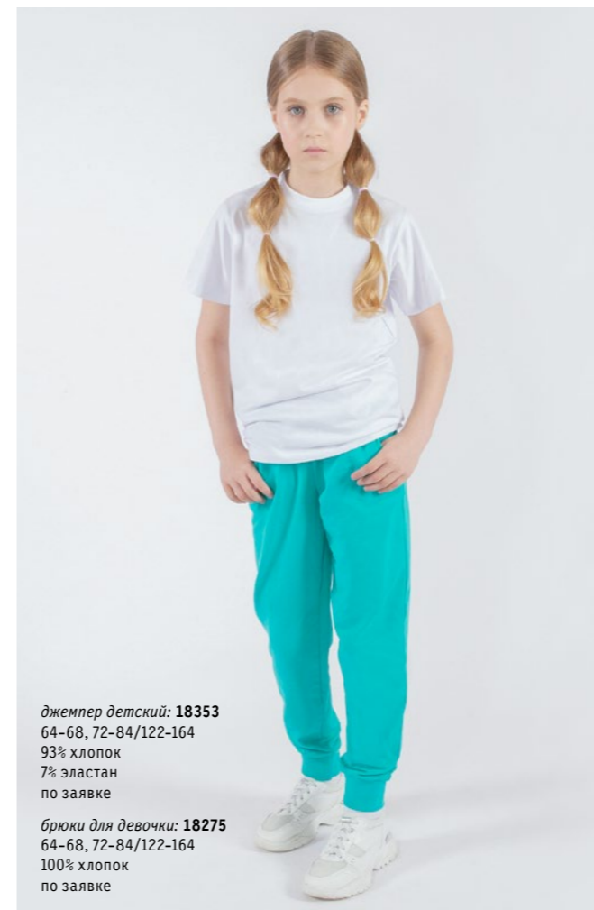
джерпер дeтский: 18353 64-68, 72-84/122-164 93% хлопок 7% эластан по заявке