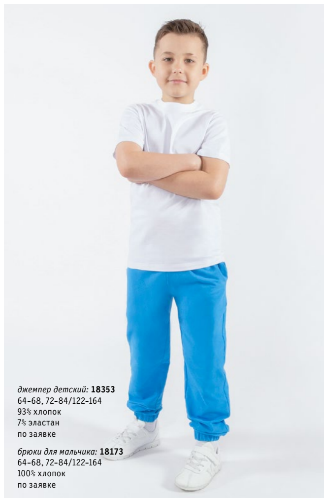
джерпер дeтский: 18353 64-68, 72-84/122-164 93% хлопок 7% эластан по заявке