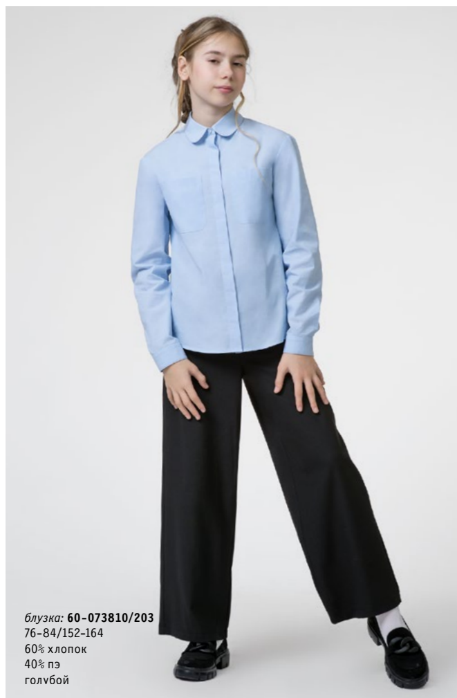
блузка: 60-073810/203 76-84/152-164 60% хлопок 40% пэ голлбой