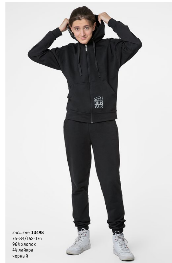
костюм: 13498 76-84/152-176 96% хлопок 4% лайкра черный