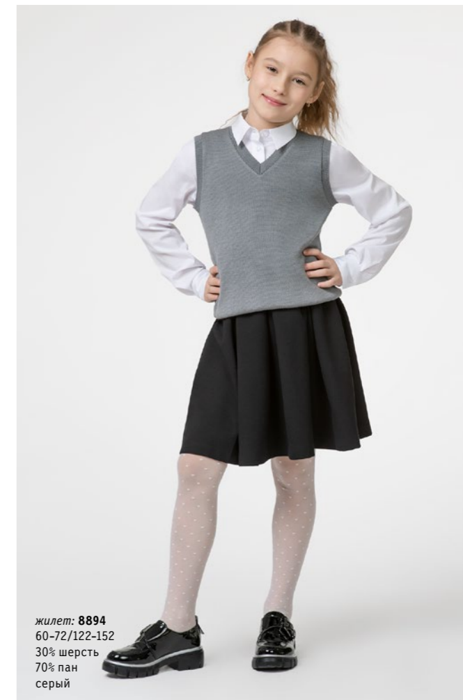
жилет: 8894 60-72/122-152 30% шерсть 70% пан серый