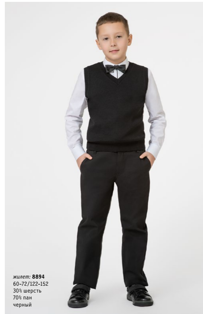
жилет: 8894 60-72/122-152 30% шерсть 70% пан черный

Все изделия выполнены из высококачественных натуральных материалов с добавлением шерсти, обеспечивая детям комфорт и свободу движения.