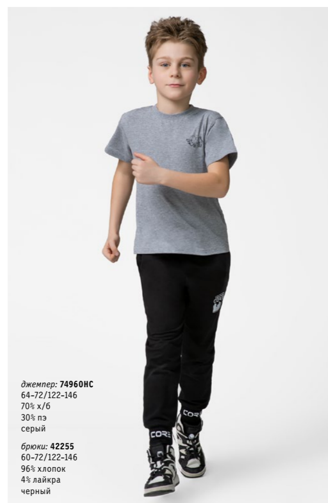
джемпер: 74960НС 64-72/122-146 70% х/б 30% пэ серый брюки: 42255 60-72/122-146 96% хлопок 4% лайкра черный

Будьте смелыми, уверенными и готовыми к новым вызовам в одежде от ОАО «Бобруйсктрикотаж».