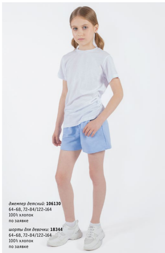
джерпер дeтский: 106130 64-68, 72-84/122-164 100% хлопок по заявке