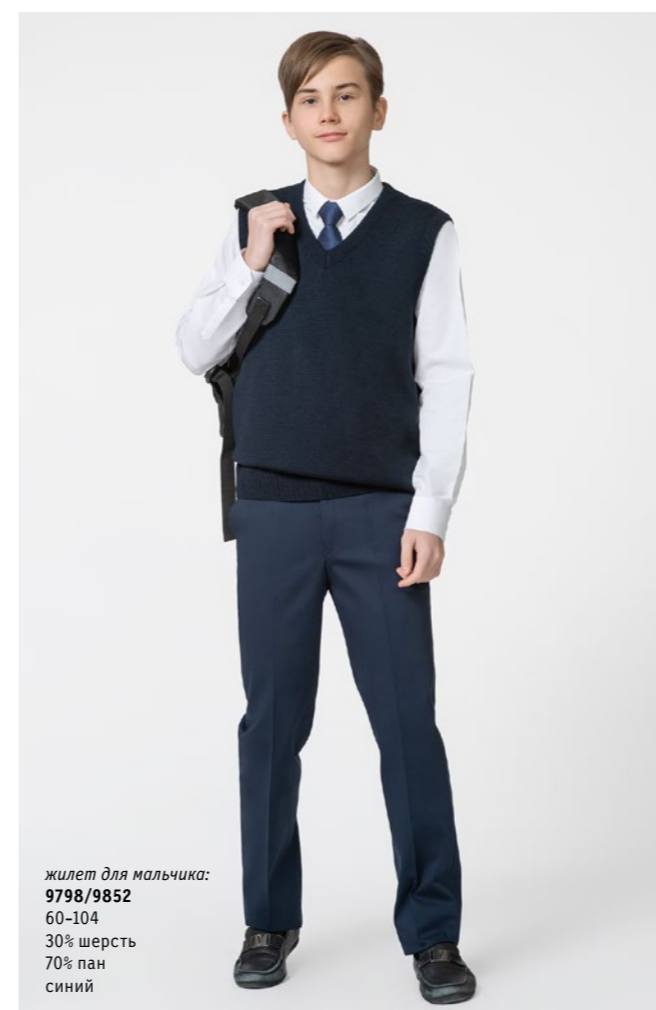
жилет для мальчика: 9798/9852 60-104 30% шерсть 70% пан синий

Ассортимент представлен однотонными жилетами и жилетами с полоской по горловине и низу изделия, а также жакетами с белой полосой. Модели выпускаются из полушерстяной пряжи в матросско-синем цвете.