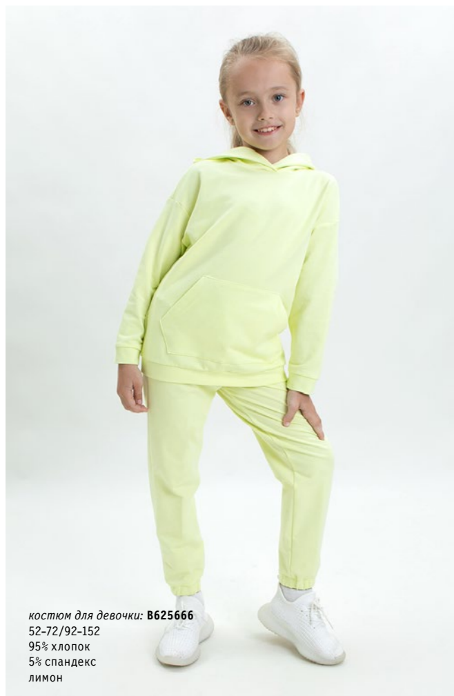
костюм для девочки: B625666 52-72/92-152 95% хлопок 5% спандекс лимон