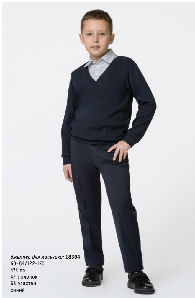
джерпер для мальчика: 18304 60-84/122-170 47% пэ 47% хлопок 6% эластан синий