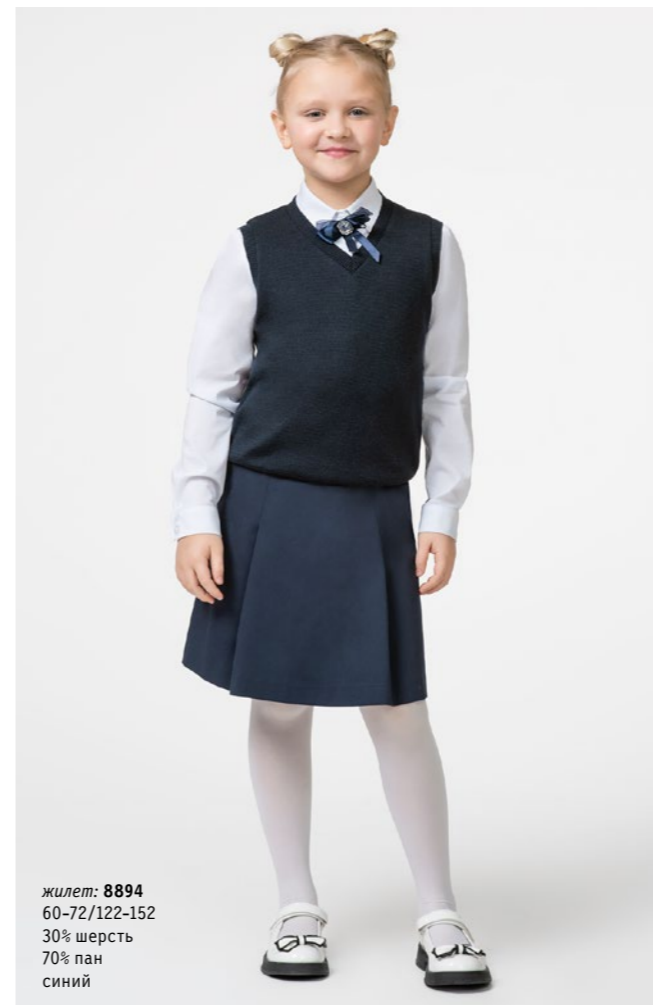
жилет: 8894 60-72/122-152 30% шерсть 70% пан синий