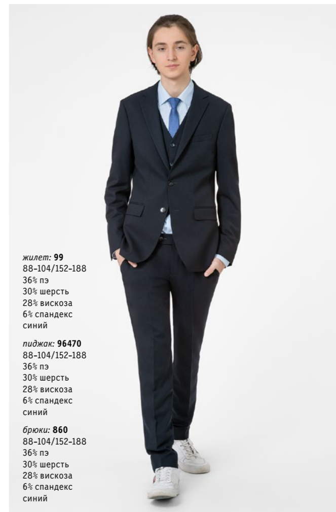
жилет: 99 88-104/152-188 36% пэ 30% шерсть 28% вискоза 6% спандекс синий пиджак: 96470 88-104/152-188 36% пэ 30% шерсть 28% вискоза 6% спандекс синий брюки: 860 88-104/152-188 36% пэ 30% шерсть 28% вискоза 6% спандекс синий