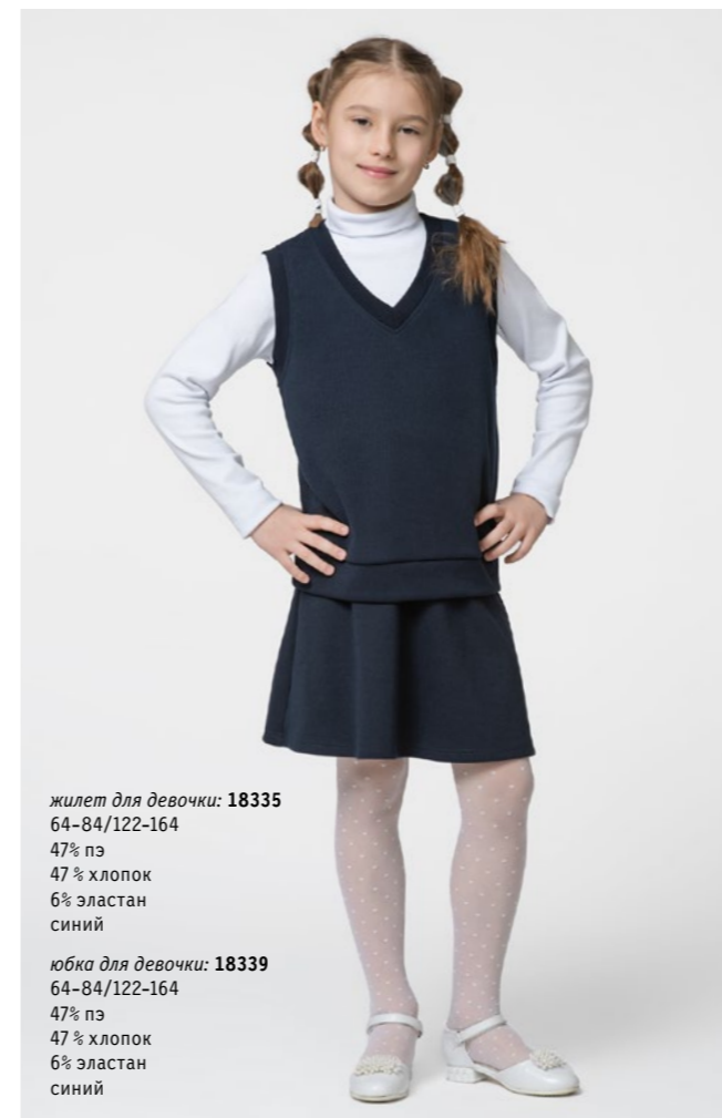
жилет для девочки: 18335 64-84/122-164 47% пэ 47% хлопок 6% эластан синий юбка для девочки: 18339 64-84/122-164 47% пэ 47% хлопок 6% эластан синий