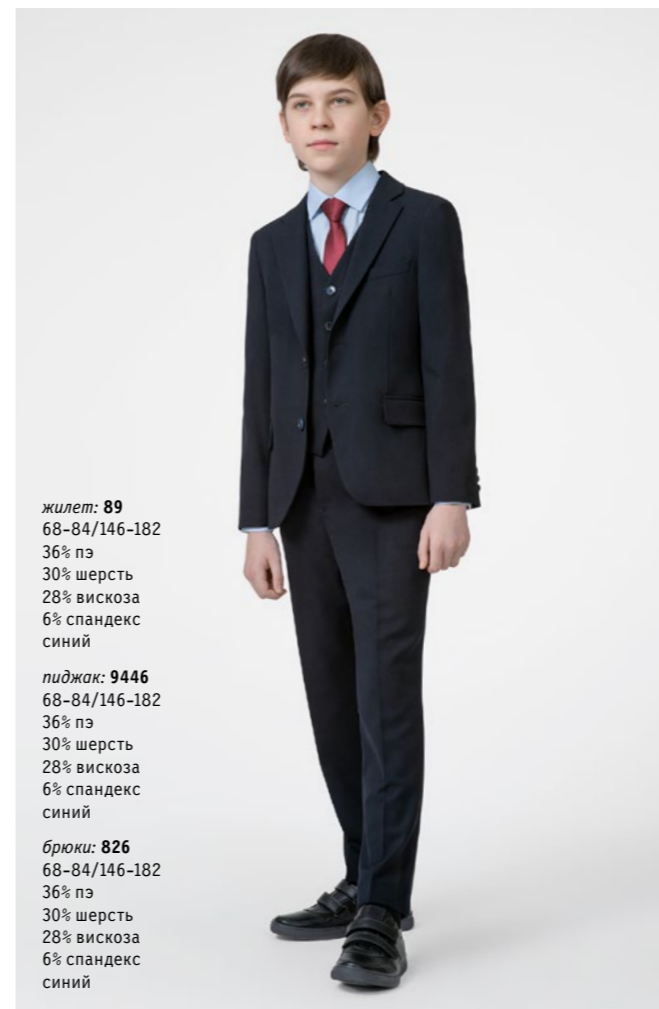
жилет: 89 68-84/146-182 36% пэ 30% шерсть 28% вискоза 6% спандекс синий пиджак: 9446 68-84/146-182 36% пэ 30% шерсть 28% вискоза 6% спандекс синий брюки: 826 68-84/146-182 36% пэ 30% шерсть 28% вискоза 6% спандекс синий