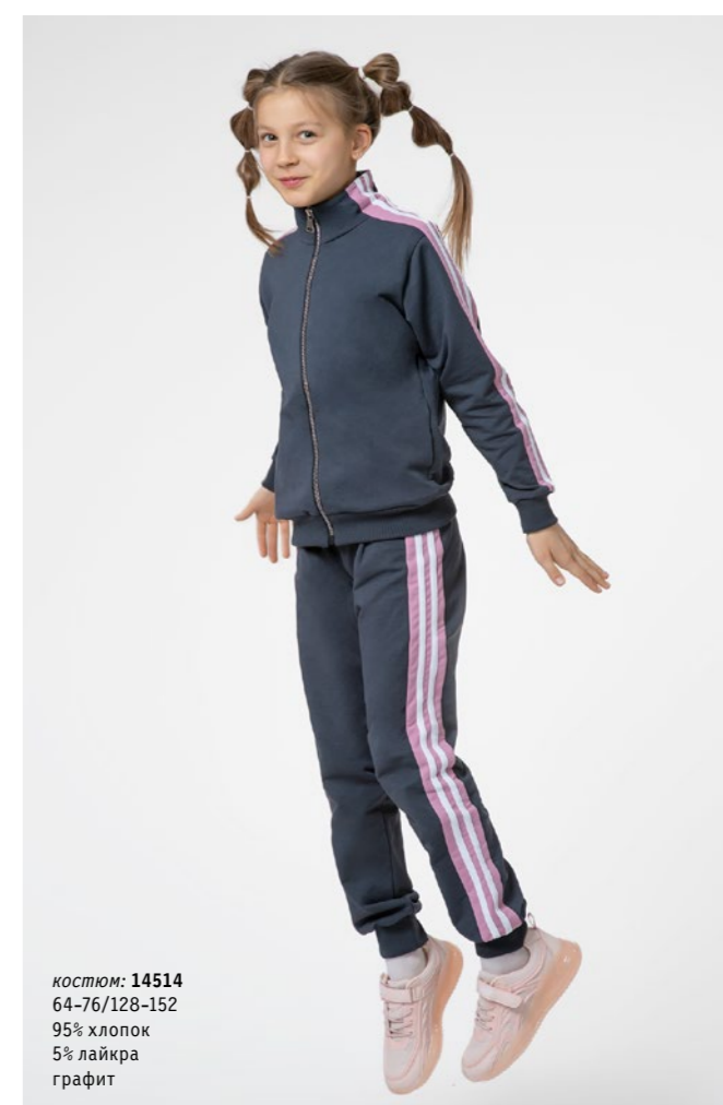
костюм: 14514 64-76/128-152 95% хлопок 5% лайкра графит