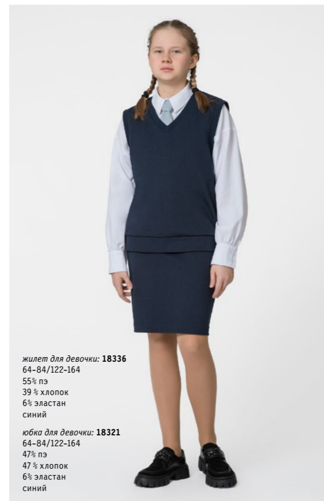
жилет для девочки: 18336 64-84/122-164 55% пэ 39% хлопок 6% эластан синий юбка для девочки: 18321 64-84/122-164 47% пэ 47% хлопок 6% эластан синий

В основе коллекции максимально удобные вещи без ярких акцентов и броских деталей, которые прекрасно дополняют школьный и повседневный гардероб ребенка.