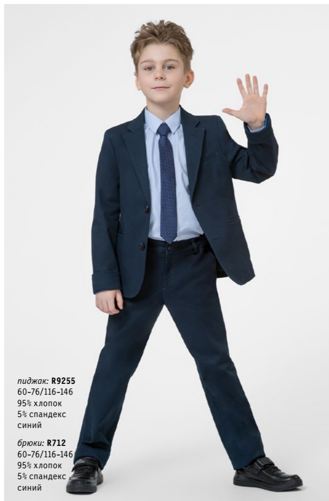
пиджак: R9255 60-76/116-146 95% хлопок 5% спандекс синий брюки: R712 60-76/116-146 95% хлопок 5% спандекс синий