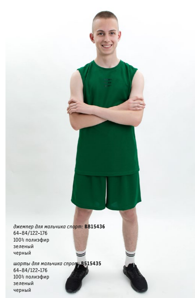
джерсер для мальчика спорт: B815436 64-84/122-176 100% полиэфир зеленый черный шорты для мальчика спорт: B515435 64-84/122-176 100% полиэфир зеленый черный