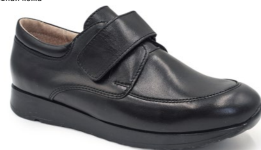
полуботинки для школьников-мальчиков: 64916 32-37 натуральная кожа натуральная кожа тэп