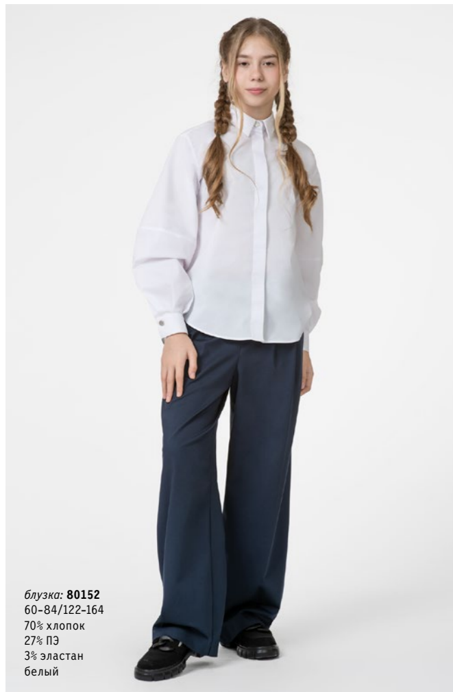
блузка: 80152 60-84/122-164 70% хлопок 27% пэ 3% эластан белый