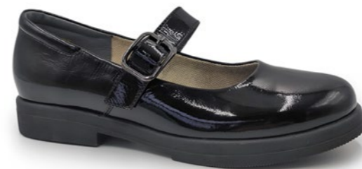
туфли девочки: 65/75091 36-41 натуральная кожа натуральная кожа тэп