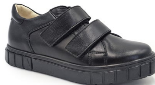
полуботинки для школьников-мальчиков: 64629 33-36 натуральная кожа натуральная кожа тэп