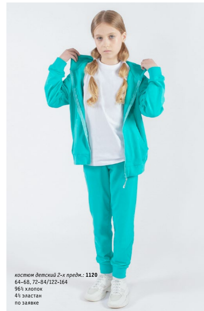
костюм детский 2-х предм.: 1120 64-68, 72-84/122-164 96% хлопок 4% эластан по заявке