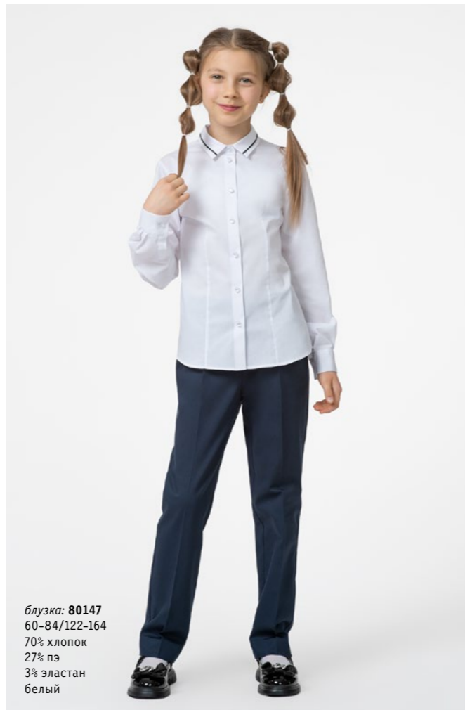
блузка: 80147 60-84/122-164 70% хлопок 27% пэ 3% эластан белый