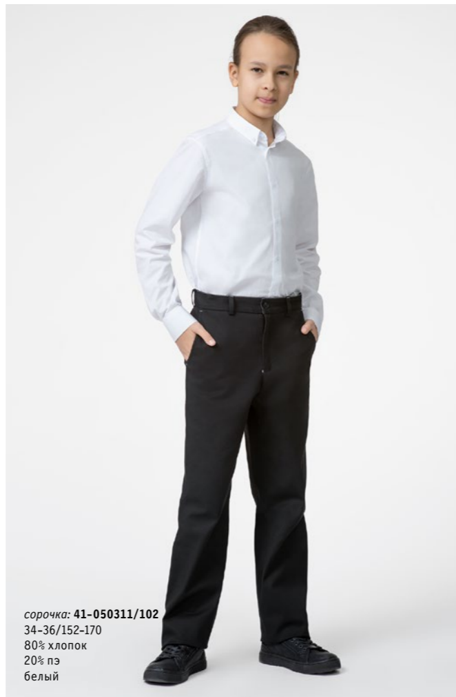
сорочка: 41-050311/102 34-36/152-170 80% хлопок 20% пэ белый