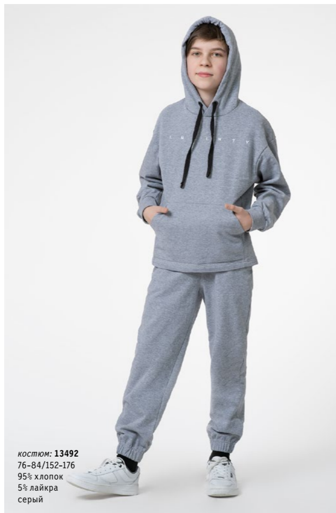
костюм: 13492 76-84/152-176 95% хлопок 5% лайкра серый