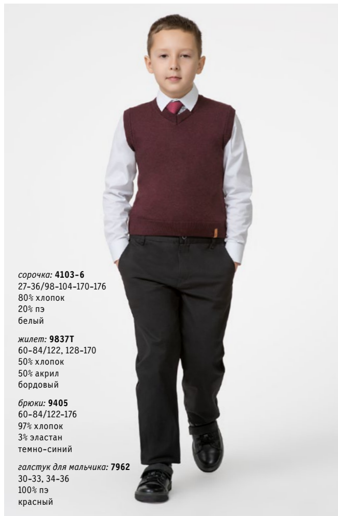
сорочка: 4103-6 27-36/98-104-170-176 80% хлопок 20% пэ белый