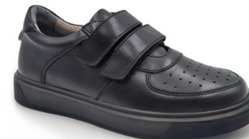
полуботинки для школьников-мальчиков: 64/74816 32-41 натуральная кожа натуральная кожа тэп